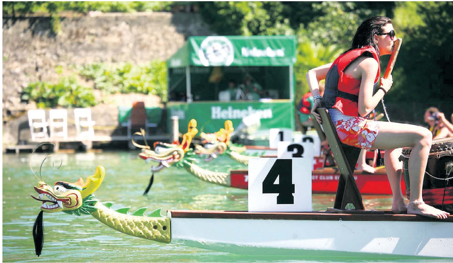
Die Drachenboote: Angetrieben durch Muskelkraft – und die Anfeuerungsrufe der Trommlerin – flitzen sie über den Rhein.